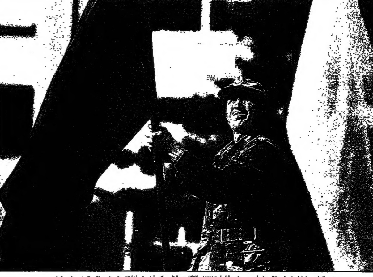
جندي الباني يشارك في احتفال نظم اسم بمناسبة إعادة افتتاح الاكاديمية العسكرية في تيرانا التي تعرضت لاصال نهب

جنيف- من جاك بوابيه. نجحت الصين في ثني البرلمان الأوروبي على مجال حقوق الانسان الذي يشكل احد معالم سياسة الاتحاد الاوروبي الخارجية، في وقت تستعد فيه الدول الـ15 لتوقيع بروتوكولها الشفوية مع معاهدة ثمانية سيطلون عليها اسم ماستريخت 2. ونجحت الامة للحدود عن رفض فرنسا، واتخذت لليها لاحقا لمانيا وايطاليا واسبانيا، وكان من المفترض ان تقدم هذا العام مع شركائها الاوروبيين الاخيرين مشروع قرار مشترك يتعهد الصين امام لجنة حقوق الانسان التابعة لامة المتحدة التي تعقد دورتها السنوية في جنيف. وقال وزير الخارجية الهولندي هان فان دير بوردو الذي تقوى بلاده حاليا الوساطة النووية للاتحاد الاوروبي وامتحتر هذا التطور تراجعها في مجال السياسة الخارجية للشركة للاتحاد. وأضاف في رسالة وجهها الاثنين على نظره الاوروبي وحصلت وكالة فرانس برس على نسخة منها ان الاطلس من ذلك هو ان المعني هو جوسر